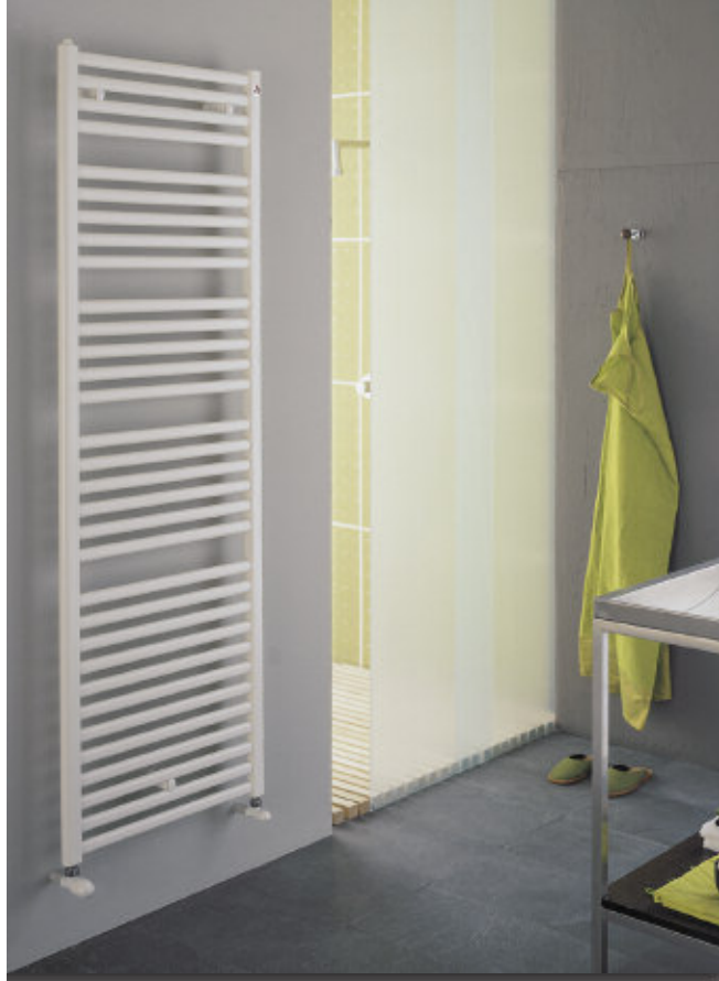
En foto: Radiadore Pareo. Altura mm 1800, anchura mm 600, color Blanco Estándar (cod. 01).